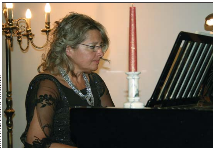
fot.: Anna Zadóra-Świderek