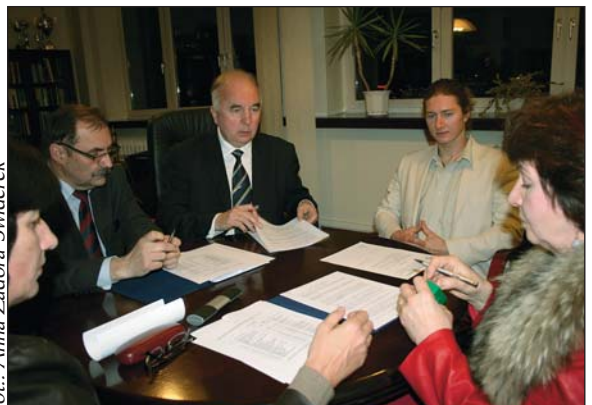
Podpisanie umowy na wynajem Domu Lekarza Seniora w Sosnowcu

Śląskiej Izby Lekarskiej osobiście lub telefonicznie pod numerem (32) 203 65 46.